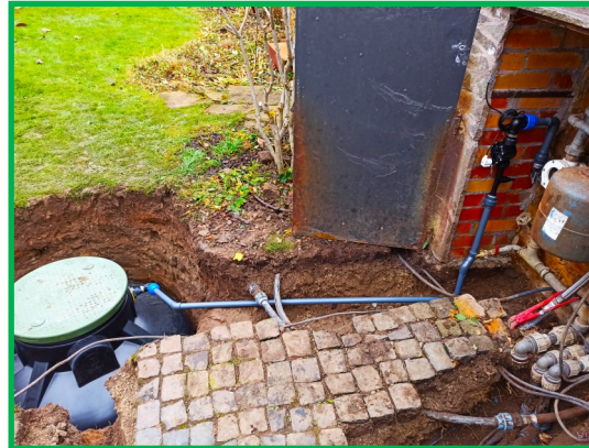
Erdtank zur Belüftung des Brunnenwassers